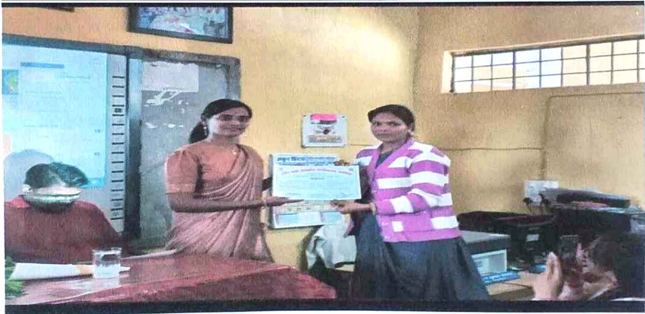
Seminar on "Strategy for CGPSC Exam"